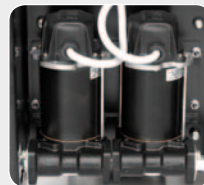
Built in DC pumps