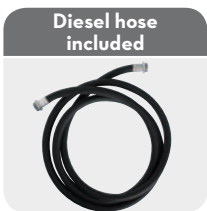
3/4"-14 m (1" - 10 m)