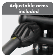
with end-of-travel hose stop.