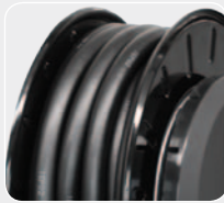
14 m hose